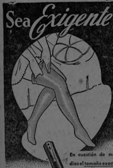
En cuestión de medidas el tamaño exacto da comodidad...